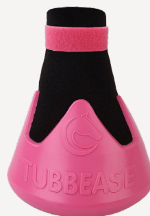
Rosa - 110mm (4 1/2 inches)