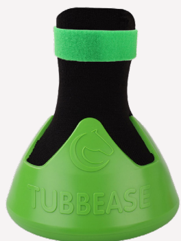
Verde - 130mm (5 1/8 inches)