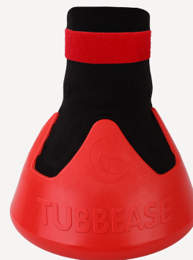
Rojo - 145mm (5 1/2 inches)