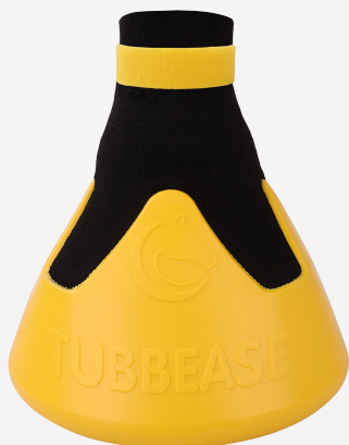
Amarillo - 175mm (7 inches)

Tenga en cuenta que las dimensiones a continuación indican el diámetro interno máximo del Tubbease, no el diámetro del casco. Tubbease también se puede colocar sobre herraduras.