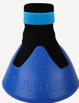
Azul - 160mm (6 1/4 inches)